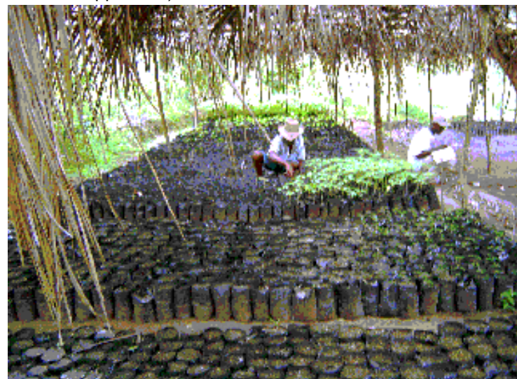
Pépinière à Pochette, financée par Désir d'Haïti